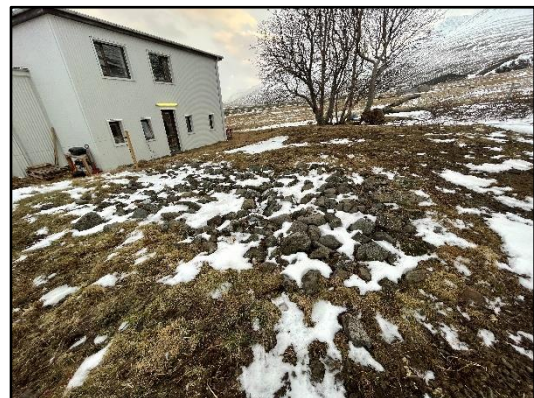
Mynd 2. Steinlögn (2714-17), horft til suðausturs.

Samkvæmt Byggðasögu Skagafjarðar (2011, bls. 104) var gamli torfbærinn bak við núverandi íbúðarhús. Í Byggðasögu Skagafjarðar (2011) segir: „Enn má sjá nokkur gömul reynitré ofan við húsið, minjar um garðinn sem var sunnan undir gamla bænum (bls. 106).“