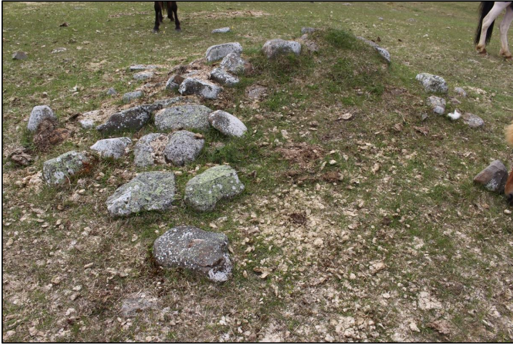
Mynd 2. Hleðslan fyrir hreinsun, horft til S.