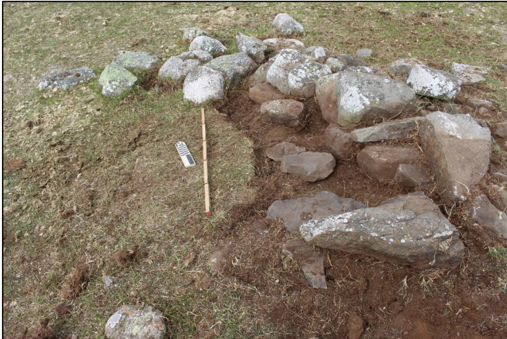
Mynd 3. Hleðslan eftir hreinsun, horft til NA.