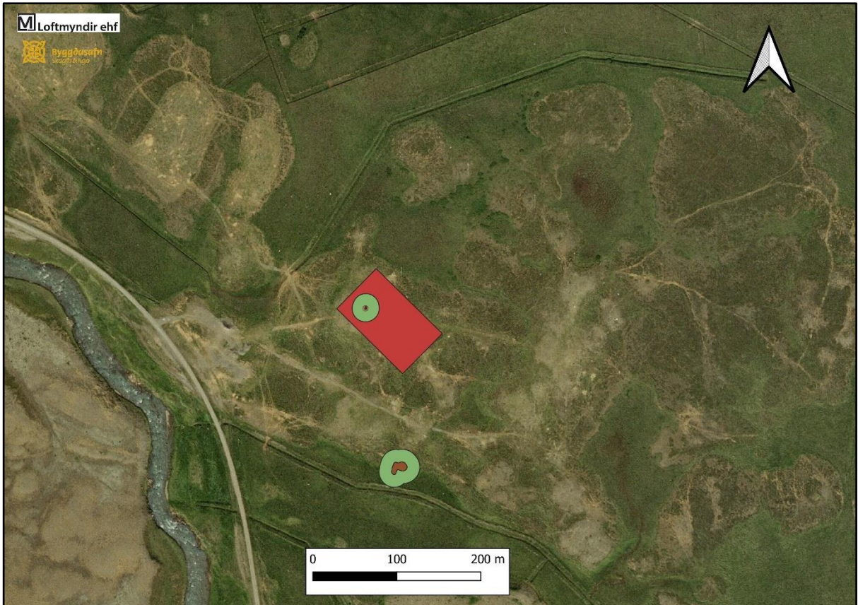
Mynd 1. Yfirlitsmyndin sýnir byggingarreitinn, í landi Neðra-Áss II, merktann með rauðu og staðsetningu minja sem skráðar voru af Minjaverði Norðurlands vestra, merktar með grænum.