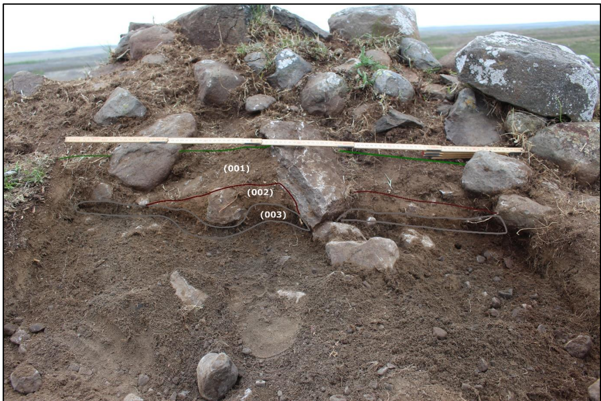
Mynd 5. Vestursnið. Jarðlag [001] samanstendur af grasrót og einsleitri fokmold. Jarðlag [002] er hreint ljósbrúnt silt og lag [003] er óhreyft lag úr mól og sandi.