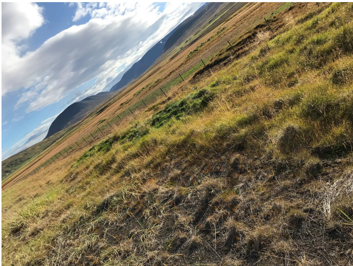
Mynd 2. Horft til norðausturs yfir tóftina. (1914-64).