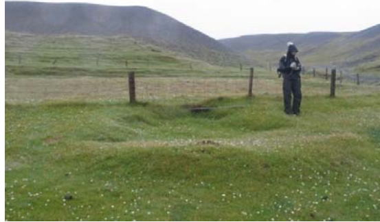
Möguleg stekkjartóft [45] rétt vestan svæðisins. Hún hefur þegar orðið fyrir skemmdum vegna jarðræktar.