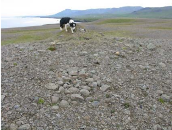
Leifar grjóthleðsla [33 og 34] um 10m utan framkvæmdasvæðisins.