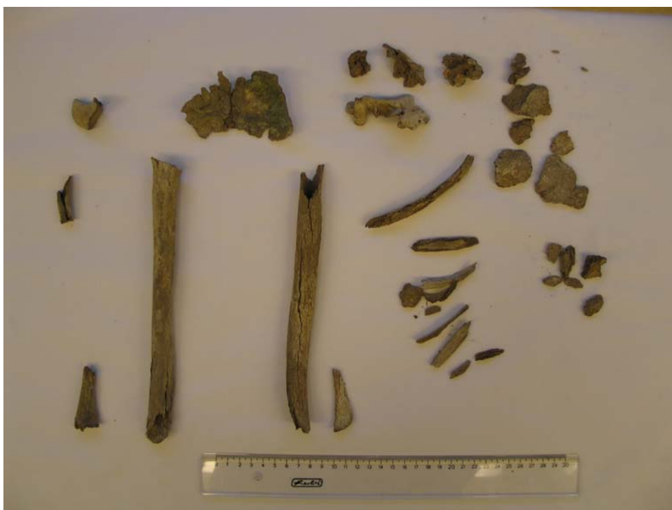
Beinaleifarnar sem fundust á Vestdalsheiðinni.