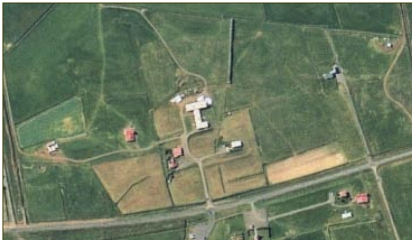
Hátún og Mikligarður árið 2000