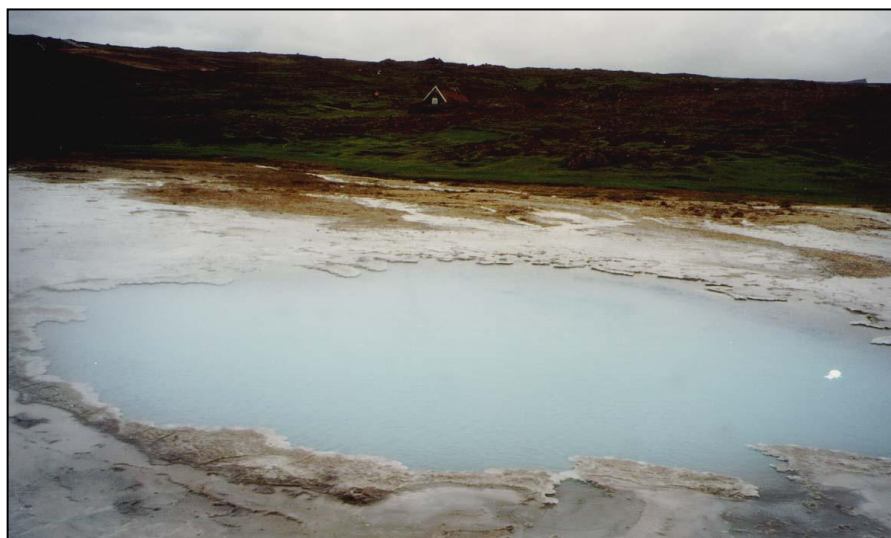
Bláhver á Hveravöllum