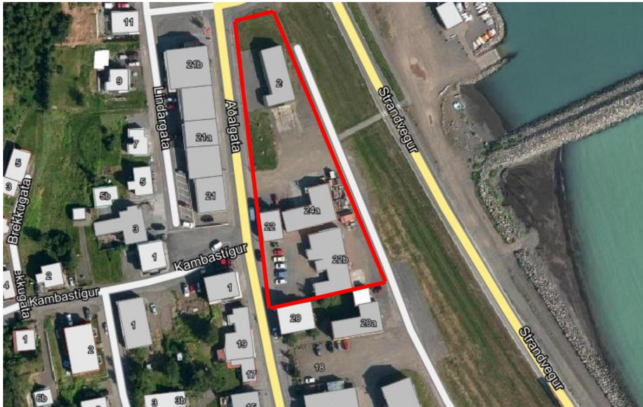
Mynd 14. Starfshópurinn leggur til að horft verði til svæðisins innan rauða ferningsins sem safnssvæði Byggðasafns Skagfirðinga til framtíðar. Afmörkun svæðisins myndi ekki hafa áhrif á þá starfsemi sem fyrir er, en verði breyting á þeirri starfsemi í framtíðinni þarf að gæta þess að það hafi ekki neikvæð áhrif á safnið og starfsemi. Svæðið í heild sinni yrði skipulagt, áfangaskipt og teiknað upp og hugsað til næstu 10-15 ára. Mynd/Skjáskot af Maps.is

sem og aðgang að styrkjum. Innan svæðisins er nú þegar starfsemi sem taka þarf tillit til, þ.e. Puffin and Friends í Aðalgötu 24 og Trésmiðjan Ýr í Aðalgötu 24a. Afmörkun svæðisins sem safnasvæðis mun þó ekki hafa áhrif á þá starfsemi sem fyrir er, en verði breyting á henni í framtíðinni þarf að gæta þess að það hafi ekki neikvæð áhrif fyrir safnið og starfsemi.