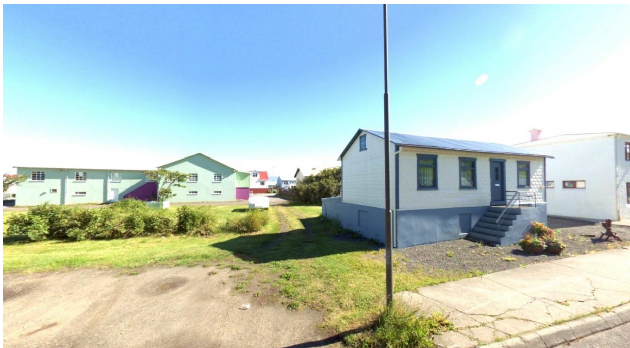
Mynd 1. Árbakki - Suðurgata 5. Í baksýn má sjá Félagsheimilið Bifröst. Á milli húsanna má sjá grænt svæði sem hugmyndin tekur til.