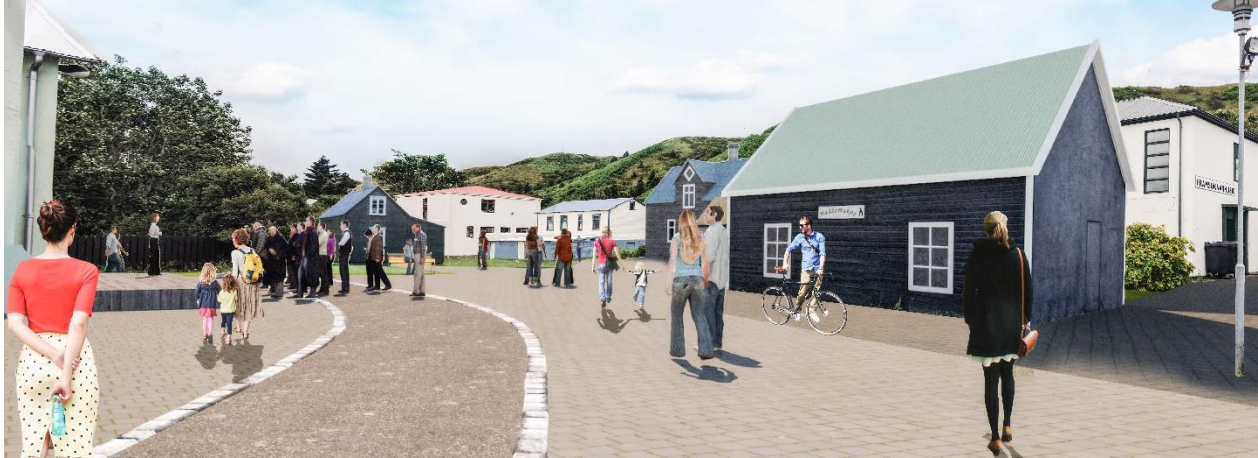
Mynd 3. Hugmyndin var að skapa port á milli Árbakka og Bifrarar. Gera þyrfti upp Árbakka og smíða hús utan um verkstæðissýningarnar austan við. Tréiðjadeild FNV hefur sýnt verkefninu áhuga. Einnig byggja hús að fyrirmynd Michelsenhúss norðan við Árbakka, undir úrsmíðaverkstæðið. Þá kom einnig sú hugmynd að færa Maddömukot í portið.