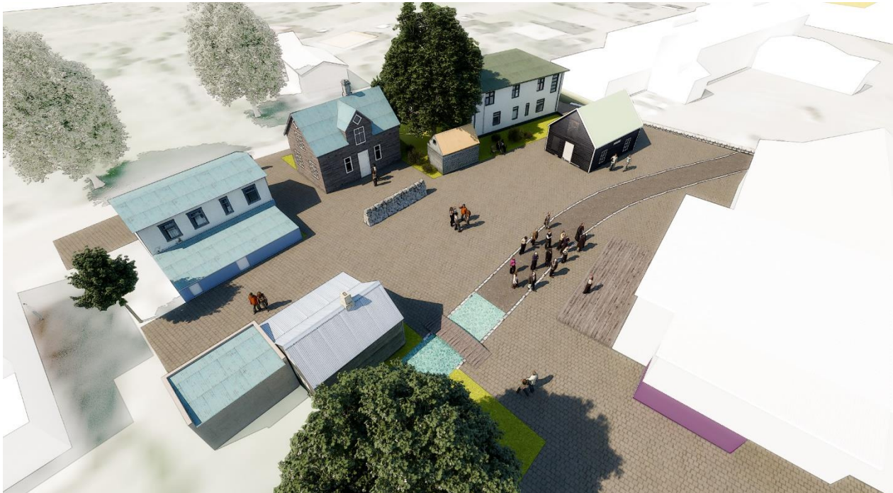
Mynd 5. Einnig kviknaði hugmynd um að gera Sauðánni skil með hellulögnum og tjörn með brú yfir, en planki var áður fyrir yfir ána þar sem tjörnin er sýnd á teikningunni. Svæðið myndi nýtast undir viðburði í bænum, s.s. tónleikahald, markaði, brúðubíllinn svo dæmi sé tekið. Mynd/Stoð, MFG.