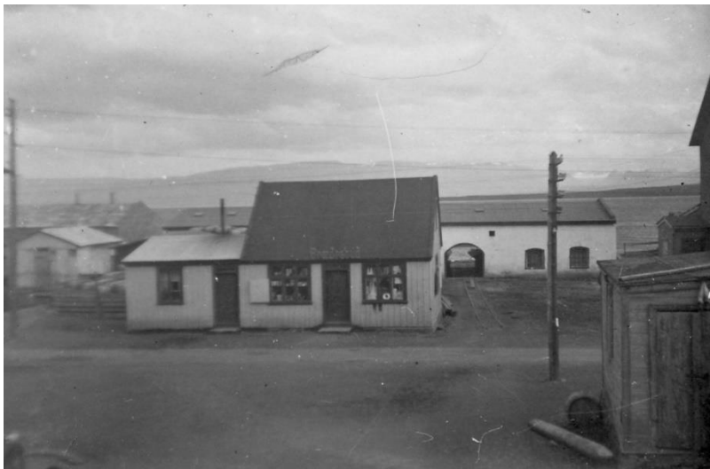
Mynd 11. Í forgrunni stendur Bræðrabúð, sem brann á tímum seinni heimstyrjaldar. Hægra megin við Bræðrabúð má sjá járnbrautateina sem lágu í gegnum Aðalgötu 22b sem sést í bakgrunni.

Húsið er nú í eigu Sveitarfélagsins Skagafjarðar og stendur ónotað fyrir utan þann hluta sem nýttur er sem vörugeymsla verslunar H.Júl. Áfast við suðvesturhlið hússins er