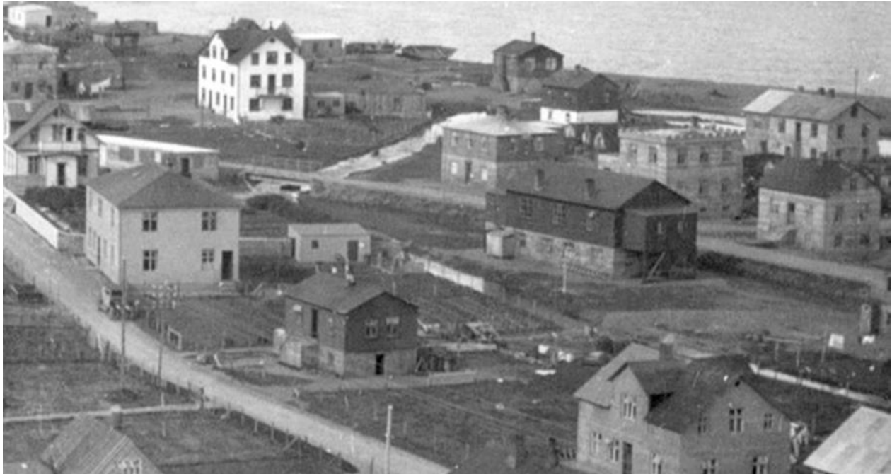
Mynd 2. Sauðárkrúkur árið 1926. Árbakki er litla húsið sem stendur nokkurn veginn fyrir miðri mynd. Sauðáin rennur austan við húsið og áfram þar sem Kirkjutorgið stendur nú. Austan við Sauðána stendur Félagsheimilið Bifröst, þá nýbyggt.