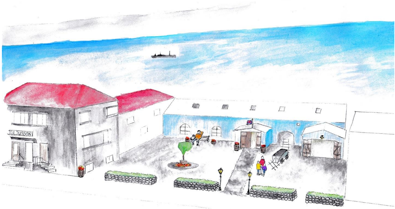
Mynd 13. Hér má sjá hvernig Aðalgata 22b gæti litið út ef yngri viðbyggingar yrðu fjarlægðar, húsið gert upp og fengið undir sýningar safnsins. Hægt væri að gera huggulegt port vestan við, með bekkjum og gróðri. Verslun H.Júl. gæti starfað áfram sem safnbúð. Gaman væri að endurgera lestarteinanna í gengum húsið og leyfa gestum að sitja vagninum í spölkorn austan við húsið. Ásýnd svæðisins myndi batna til muna og yrði íbúum sem gestum bæjarins til ánægju og yndisauka.

verið í notkun frá árinu 1941 en hin er safngripur, með merki danska konungsins og var notuð frá 1919 til 1941 (Byggðasafn Skagfirðinga, 2020).