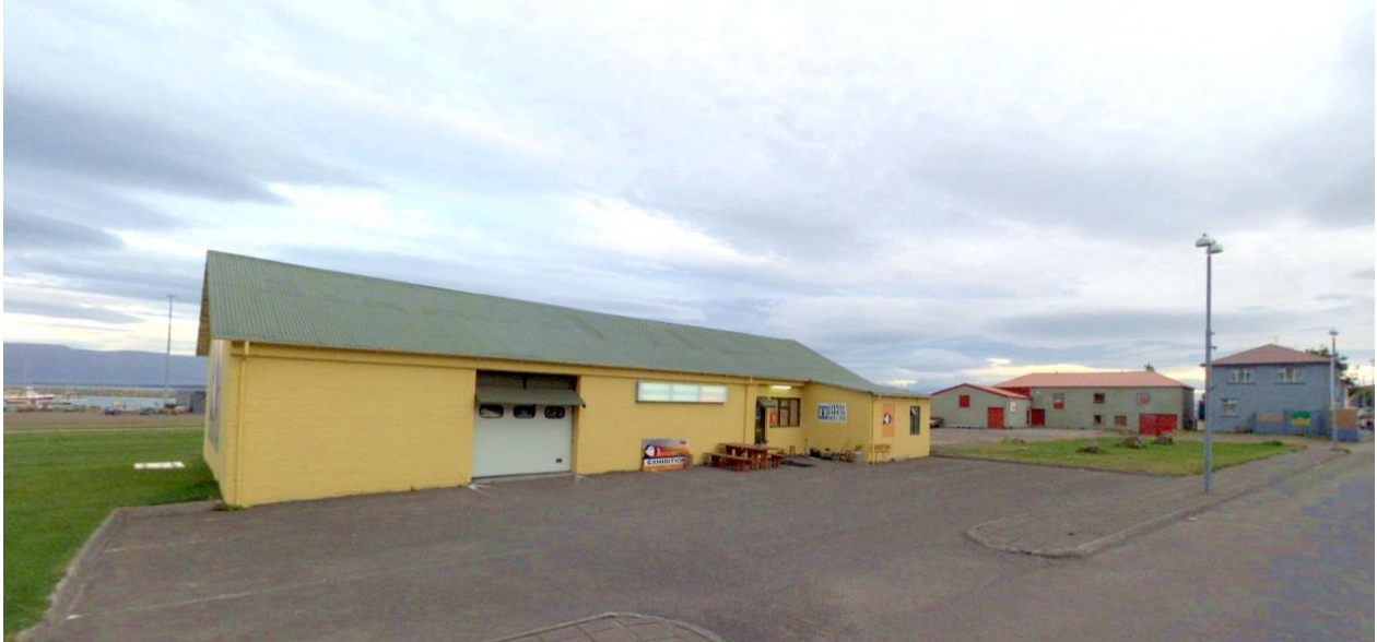
Mynd 6. Tengilshús / Puffin and Friends við Aðalgötu 24. Hugmyndin er að gera við húsið og byggja við til suðurs.