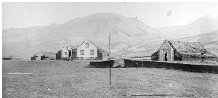
Kirkjur stóðu yfirleitt ekki langt frá bæjarhúsum. Kirkjugarðar fyrr á öldum voru flestir hring- eða sporöskjulaga. Myndin er frá Flugumýri.

Grafreitir (kirkjugarðar) voru oftast afmarkaðir af hlöðnum torf-eða grjóttveggjum og yfirleitt nærri bæjarhólum. Fjöldi grafa hefur fundist þar sem engar heimildir eru til um kirkjur, sem bendir til að víðar hafi verið jarðað á fyrstu öldum kristni en ætlað hefur verið.