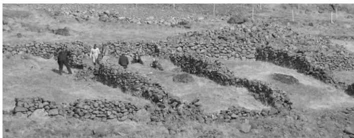
Hér er verið að gera við blöðslur í gamalli skilarétt í Silfrastaðafjalli.

Rekavinnslustaður: Staður þar sem gott aðgengi var í rekafjöruna og öruggt fyrir sjávarágangi. Örnefni vísa til þessara staða, en þeir hafa vaflaust færst til eftir því hvernig/hvort strandlengjan breyttist.