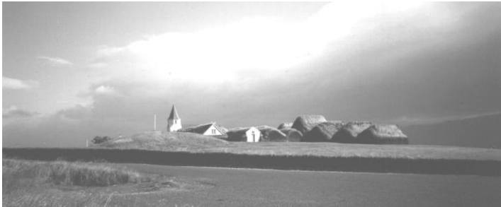
Torfhlaðinn túngarður er umhverfis Glaumba á Langbolti í Skagafirði. Sigr.Sig.

Túngarður: Hlaðinn garðveggur úr torfi og/eða grjóti, til að verja tún.