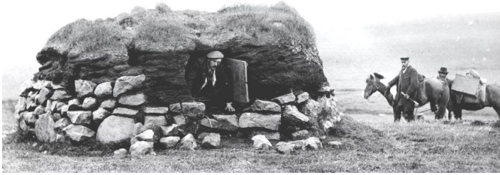
Sæluhús við Galtará á Kjalvegi 1897. Nú eru þar uppgrónar rústir og fátt að sjá.

Sæluhús: torf- og/eða grjóthlaðnir kofar við fjallvegi. Tóftir sæluhúsa má finna við gamla fjallvegi þar sem áður lá alfaraleið. Rústir þeirra líkjast helst tattum húsa, s.s. skemma, heima við bæi.