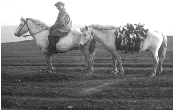
Reiðgötur eru greinilegar. Drengur á beimleið úr fengsalli fuglaveiðiferð. Ljós. HSk.

Garðlög: Margskonar garðlög er að finna umhverfis tún og utan þeirra. Bæjarstæði voru oftast afmörkuð með hlöðnum túngarði þá oftast úr grjóti og torfi. Garðar umhverfis beitarhús geta verið vísbendingar um að áður hafi verið þar býli. Vallargarðar eru garðar utan túna. Oft er erfitt að geta sér til um not þessara garða en líklega hafa þeir þjónað þeim tilgangi að aðgreina land í nytjaeiningar. Svo-kallaðir landamerkjagarðar voru einnig hlaðnir á mörkum landeigna.