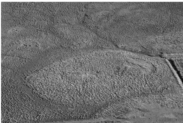
Loftmynd af gerðinu á Örlygsstöðum. Þástir innan garðs tilbeyrðu sennilega fornbylí.

Gerði: Afgirt svæði yfirleitt með hlöðnum garðveggjum umhverfis. Sennilega eru þau í flestum tilfellum leifar fornbylí.