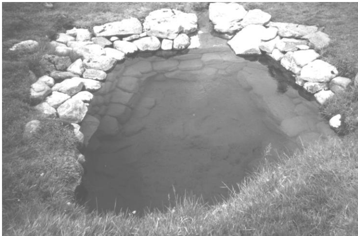
Myndin er af Biskupslaug á Reykjum í Hjaltadal. Upphlaðin baðlaug með seti. Mynd. Sigr. Sig.

Beðasléttur: Leifar túnsléttunar frá um 1880-1925. Minjar um þúfnasléttun , jarðrækt sem unnin var í höndunum og hafa yfirleitt verið útmáðar. Helst sjáanlegar á eyðibýlum sem fóru í eyði fyrir vélvæðingu. Beðasléttur eru fremur mjóir, lítið eitt kýfðir teigar með rásum (rás-um) á milli þannig að vatn rennur af þeim.