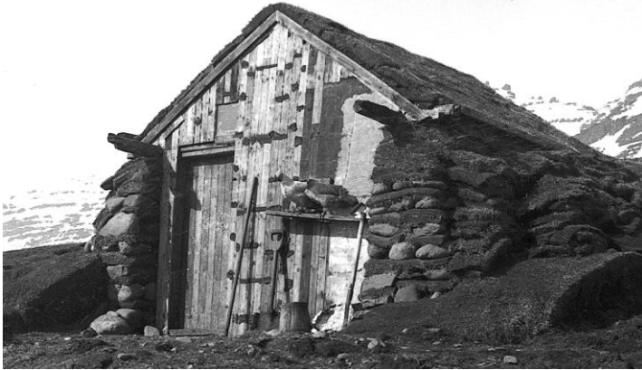
Þessi hænսnakofi hefur sennilega áður verið skemma, þar sem verkfæri voru geymd.

Kofar: Torf- og grjóthlaðnir kofar til geymslu búfjár, hænсна, eða annarra eigna.