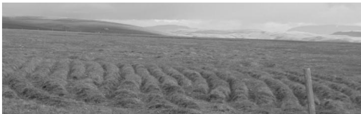
Gamlar reiðgötur eru víða enn vel sýnilegar. Ljós. Sigr.Sig.

Þar til myndast hefur greinileg slóð, gata, götur sem haldast árum og árhundruðum saman.