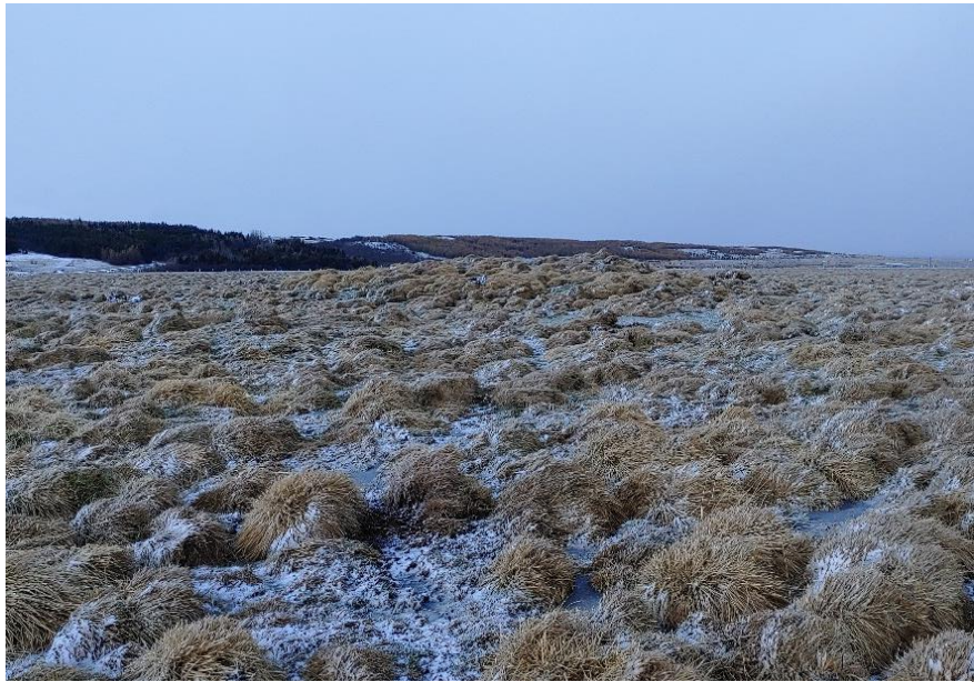
Mynd 2. Þúst í landi Víðimels. Horft til norðvesturs.

Hún er mjög áberandi í landslaginu og sker sig úr flatlendinu í kring, rúmlega 1 m há þar sem hún er hæst og öll stórþýfð eins og umhverfið. Þústin er sinuvaxin og grjót vart greinanlegt í henni.