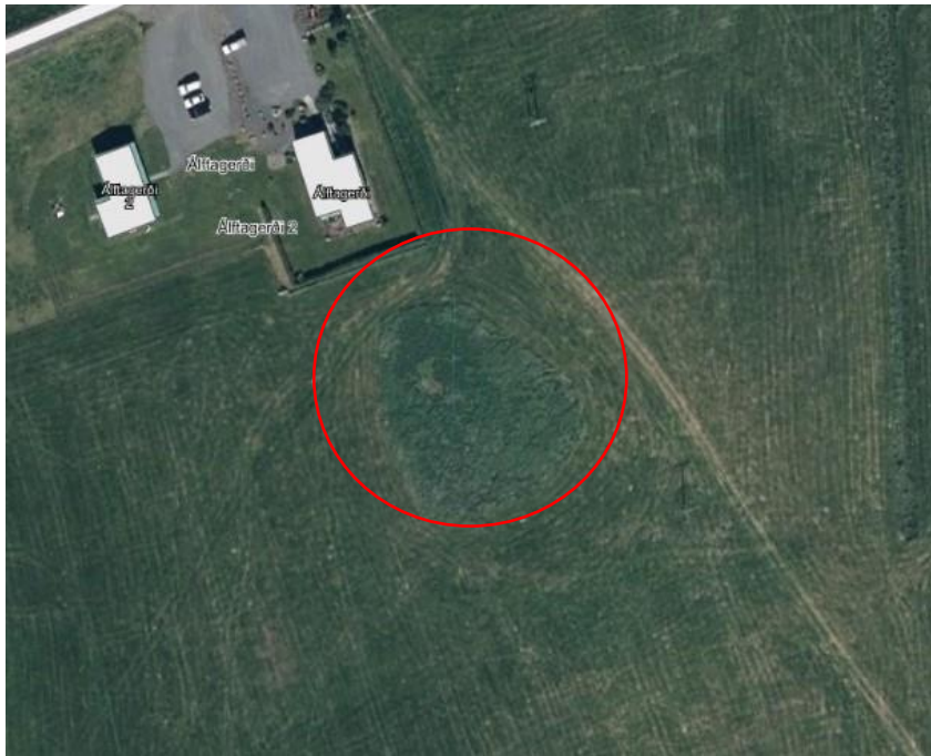
Mynd 3. Bæjarhóll Álftagerðis innan rauða hringsins.