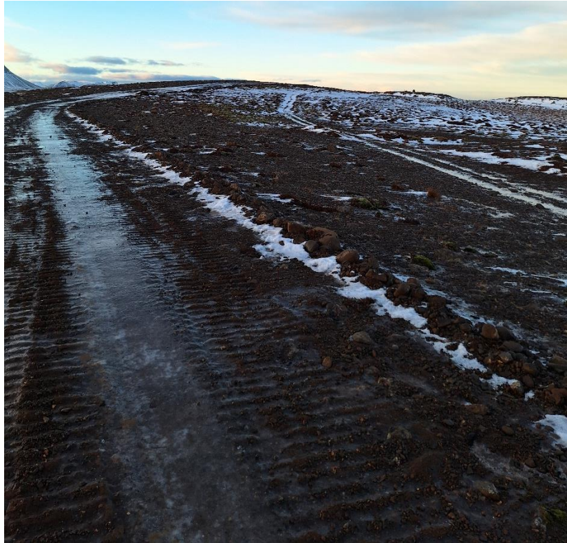
Mynd 2. Gamla leiðin [3179-1] til hægri, nýi vegurinn til vinstri. Þarna liggur vegurinn upp á Skálaholtið suðaustanvert og var ekki lagður ofan á gömlu leiðina. Gamla leiðin er einna greinilegust á þessum parti. Horft til vesturs.

Leiðin er merkt inn á herforingjaráðskorti frá árunum 1910 og lá skv. því einungis upp að túnfætinum í Jónsnesi en ekki inn á túnið.