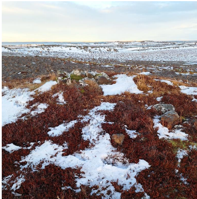
Mynd 5. Hleðsla [3179-3], hugsanleg dys. Horft til norðurs.

Um er að ræða jarðlega hleðslu, um 3,5x2,5 m að ummáli. Einföld steinaröð myndar ferhyrning með totu til suðurs. Meira áberandi hleðsla er í NV-horni, um 1x1,3 m að ummáli. Grjót er mjög sokkið og mosavaxið. Hlutverk hleðslunnar er óþekkt, mögulega vörðubrot en gæti einnig verið dys. Frá staðnum sést bæði heim að Hofsstöðum og til Jónsness.