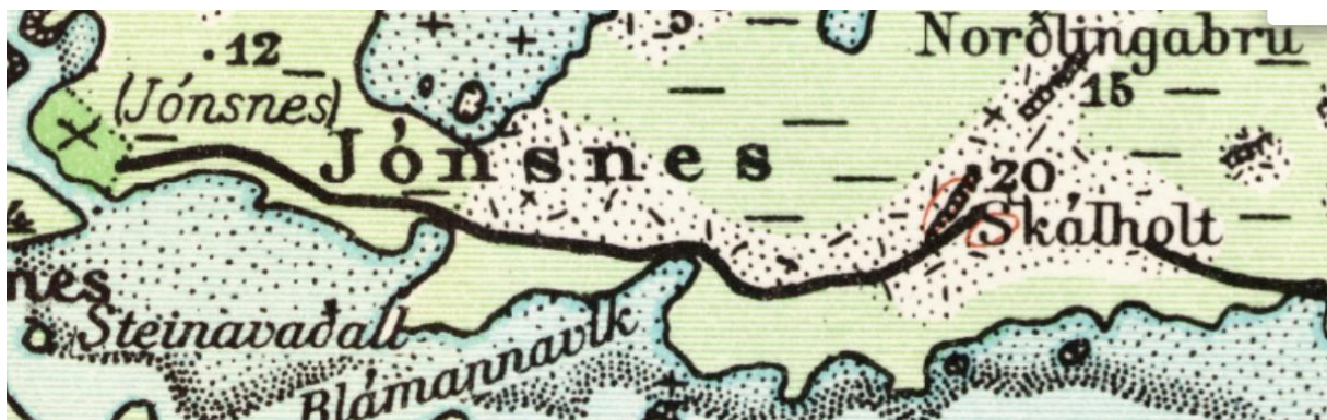
Mynd 3. Leiðin á herforingjaráðskorti. Skjáskot af Landupplýsingagátt Landmælinga.