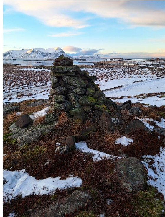
Mynd 4. Varða [3179-2]. Horft til VNV.

Varðan er stöndug, um 1,4 m á hæð og 1x1,2 m að grunnfleti. 12 umför grjóts eru sjáanleg í henni, meðalstórt grjót að mestu. Grjótið er fléttugróið. Bakendi vörðunnar, til NNA, er nokkuð hrúnn. Hugsanlega leiðarvarða eða innsiglingarvarða.