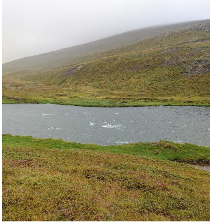
Mynd 7. Eiríksvað [3105-7]. Horf til suðvesturs.

Nákvæm staðsetning vaðsins er ekki þekkt en það var skráð á sama stað og í fornleifaskráningu 2004 (Elín Ósk Hreiðarsdóttir og Birna Lárusdóttir 2003). Þar er áin breið og