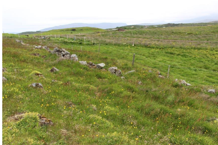
Mynd 19. Norðurhluti garðlags [3061-12], horft til ASA.

tekið úr hleðslum, sér í lagi að austan, en garðlagið er ekki heilt þar. Mjög stórt grjót myndar norðurhlið og hluta austurhliðar garðlagsins. Vestur og suðurhlið eru lægri og yfirgrónari, og hluta komin inn á tún. Girðing liggur sunnan við norðurhlið garðsins og er tún sunnan hennar. Garðlagið hefur líklega afmarkað svæði á einhverjum tímamarki, verið rétt eða garður. Miðað við staðsetningu er garðlagið í túnjaðri eða jafnvel utan túns miðað við túnakort frá 1916 en er ekki merkt inn á það kort.