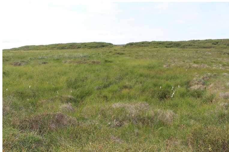
Mynd 3. Mógröf [3061-1], horft til norðurs.

Mógröfin er ekki sérlega greinileg á jörðu niðri en sést nokkuð vel á loftmynd. Gröfin er nokkuð blaut og meiri stór vaxa í henni en í umhverfinu annars. Mógröfin er lengst um 35 m og breiðust um 15 m, dýptin er mest um 60 cm. Læna liggur frá mógröfinni og niður í víkina og rennur vatn um hana niður úr gröfinni.