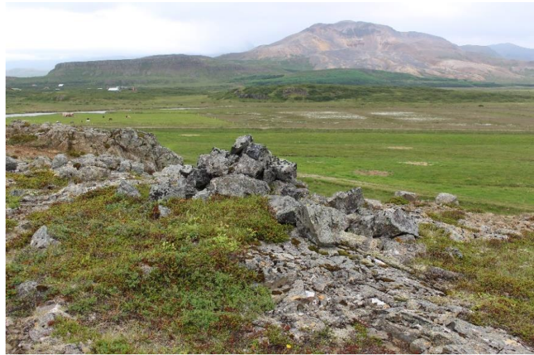
Mynd 13. Varða [3061-8], horf til suðurs.

Nú eru um 4-5 umför hleðslu sjáanlega í henni. Stórt grjót er í botni vörðunnar en minna þegar ofar dregur, allt fléttugróið.