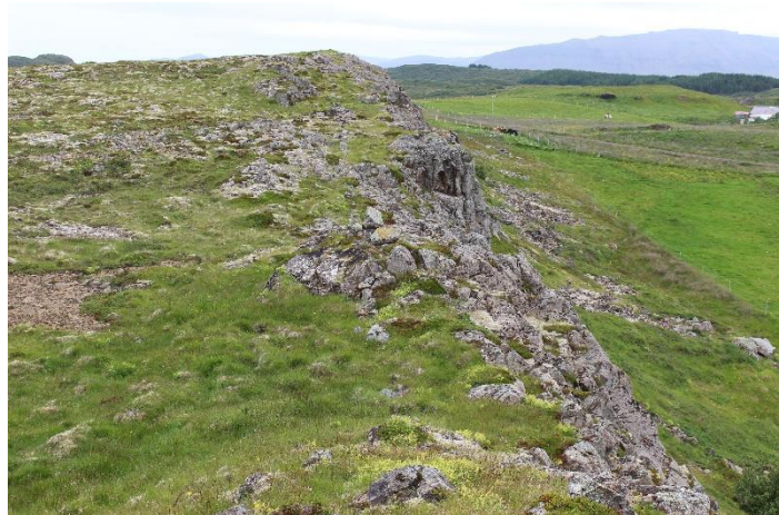
Mynd 18. Garðlag [3061-11] u.þ.b. fyrir miðri Borginni. Horft til austurs. Garðalgið er ógreinileg lína rétt innan við klettabrúnina.

Hleðslan er mjög sokkin og ógreinilega á köflum en annars staðar greinileg. Hæst er hún um 40 cm en yfirleitt lægri. Breiðust er hún um 80 cm austast, en yfirleitt mun mjórri. Grjótið er stærra austast en yfirleitt minna þegar upp á Borgina er komið og vestureftir henni. 1-2 steinaumför sjást og eru steinarnir yfirleitt fléttu- og mosagrónir. Hleðslan heldur áfram inn í land Norðuráss.