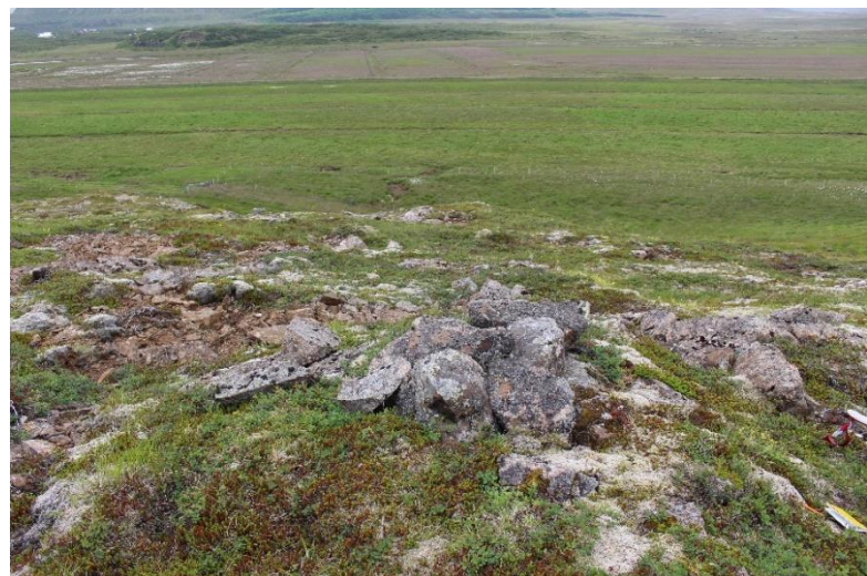
Mynd 8. Varða [3061-5], horft til suðurs.

Varðan er mest um 20 cm há og um 1x0,6 m að grunnfleti. Varðan er mjög hrunin og sigrin og sjást steinar í kring sem gætu verið hrun úr henni. Hleðsla vörðunnar sem stendur er í raun einungis eitt umfar. Steinar eru stórir og meðalstórir og fléttugróinir.