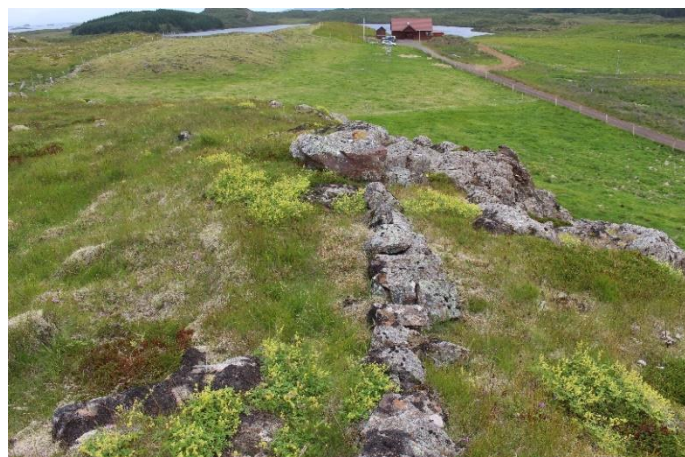
Mynd 17. Garðlag [3061-11] austarlega á Borginni, horft til austurs, Norðurás í baksýn.

Á blábrún Borgarinnar norðvestan við bæjarstæði Saura, nokkurn veginn alla leiðina með brúninni og niður af henni austanmegin er lág hleðsla/steinaröð, líklega undirhleðsla undan girðingu.