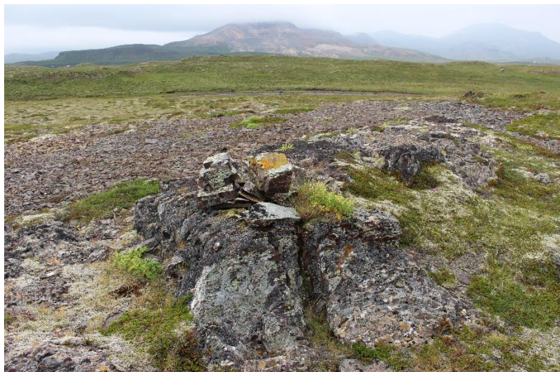
Mynd 6. Varða [3061-3], horft til suðurs.

Varðan er mest um 30 cm há og um 50x60 cm að grunnfleti. Varðan er farin að gliðna og er aðeins hrunin, grjót er til hliðanna sem gæti hafa hrunið úr henni og því hefur hún líklega verið nokkuð hærri. Hleðsla vörðunnar er ekki vonduð en grjótið er allt fléttugróið.