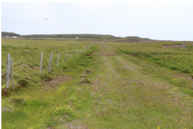
Mynd 12. Gamli þjóðvegurinn [3061-7] horft til NNV í átt að Vogaskeiðum.