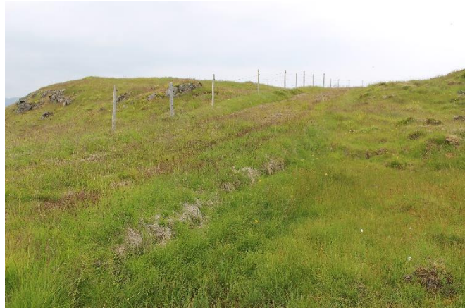
Mynd 11. Gamli þjóðvegurinn [3061-7] horft til norðvesturs þar sem vegurinn liggur vestan við Stekkjarholt. Sést í smá upphleðslu í kantinum næst á myndinni.