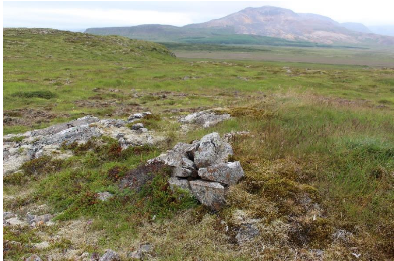
Mynd 7. Varða [3061-4], horft til suðurs.

Varðan er mest um 50 cm há og um 80x60 cm að grunnfleti. Í vörðunni sjást þrjú umför hleðslu og í henni er meðalstórt grjót, fléttugróið. Staðsetning vörðunnar er nokkuð sérstök, austan í litlu holti en ekki á hápunkti þess.