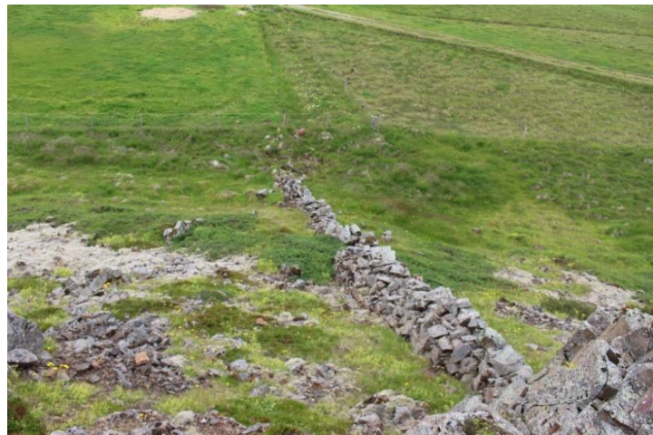
Mynd 16. Garðlag [3061-19], horft til suðurs.

Garðlagið er víðast ekki haganlega hlaðið en er þó ansi stæðilegt. Hæð þess er um 0,4-1,1 m og það er mest um 1 m breitt. Í garðlaginu er mest