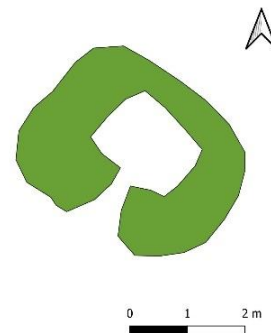
Mynd 9. Uppmæling af tóft [3061-6].