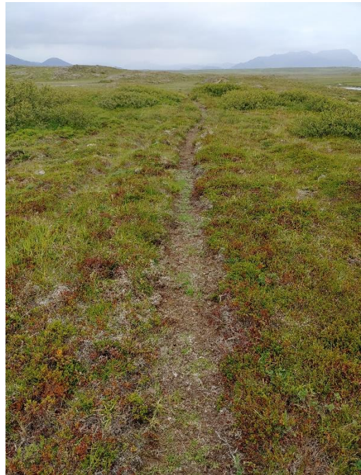
Mynd 1. Dæmi um kindagötu/götu á svæðinu, horft til vesturs.