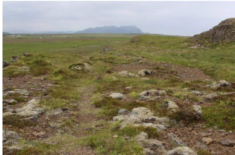
Mynd 14. Hugsanlega gata [3061-9]. Um svæðið liggja nokkrar kindagötur/götur, en þetta er sú greinlegasta.

Borgina. Nú eru á svæðinu nokkrar kindagötur og erfitt að greina á jörðu niðri hver þeirra gæti verið gamla leiðin, en á loftmynd sést móta sérstaklega fyrir einni götu og var lína sett á hana af loftmynd. Línan er þó eingöngu til viðmiðunar en er ekki endilega nákvæm staðsetning þessarar leiðar.