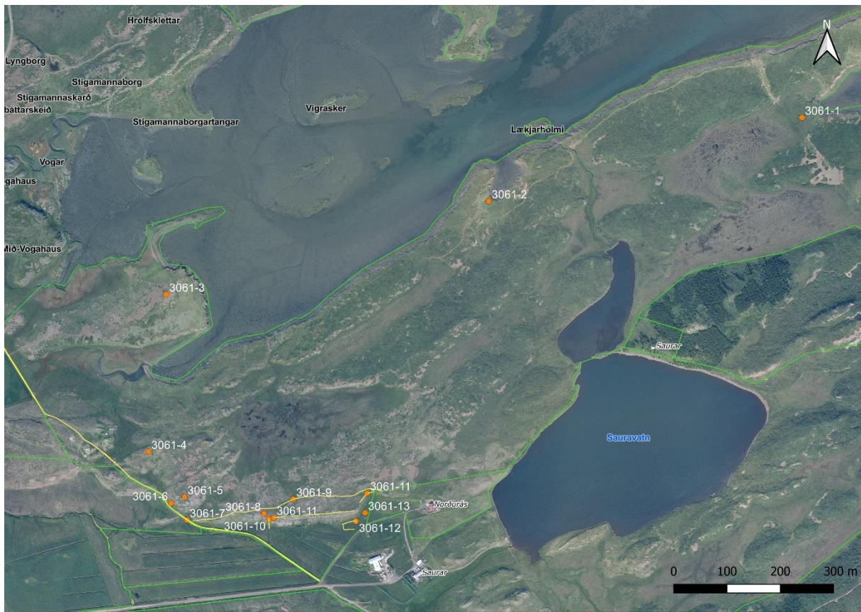
Mynd 2. Yfirlitskort af skráningarsvæðinu. Appelsínugulir punktar eru skráðar fornleifar, gular línur eru skráðar leiðir og garðlög.