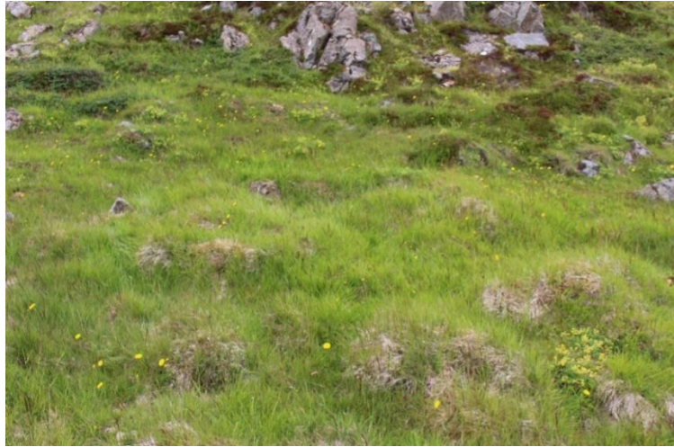
Mynd 10. Tóft [3061-6], horft til austurs.

Ekki er um stekkin sem Stekkjarholtið heitir eftir að ræða því hann er vestan við veginn, Grjótstekkur kallaður, utan lands Saura 9. Ekki er þó loku fyrir það skotið að þessi tóft tengist stekknum á einhvern hátt.