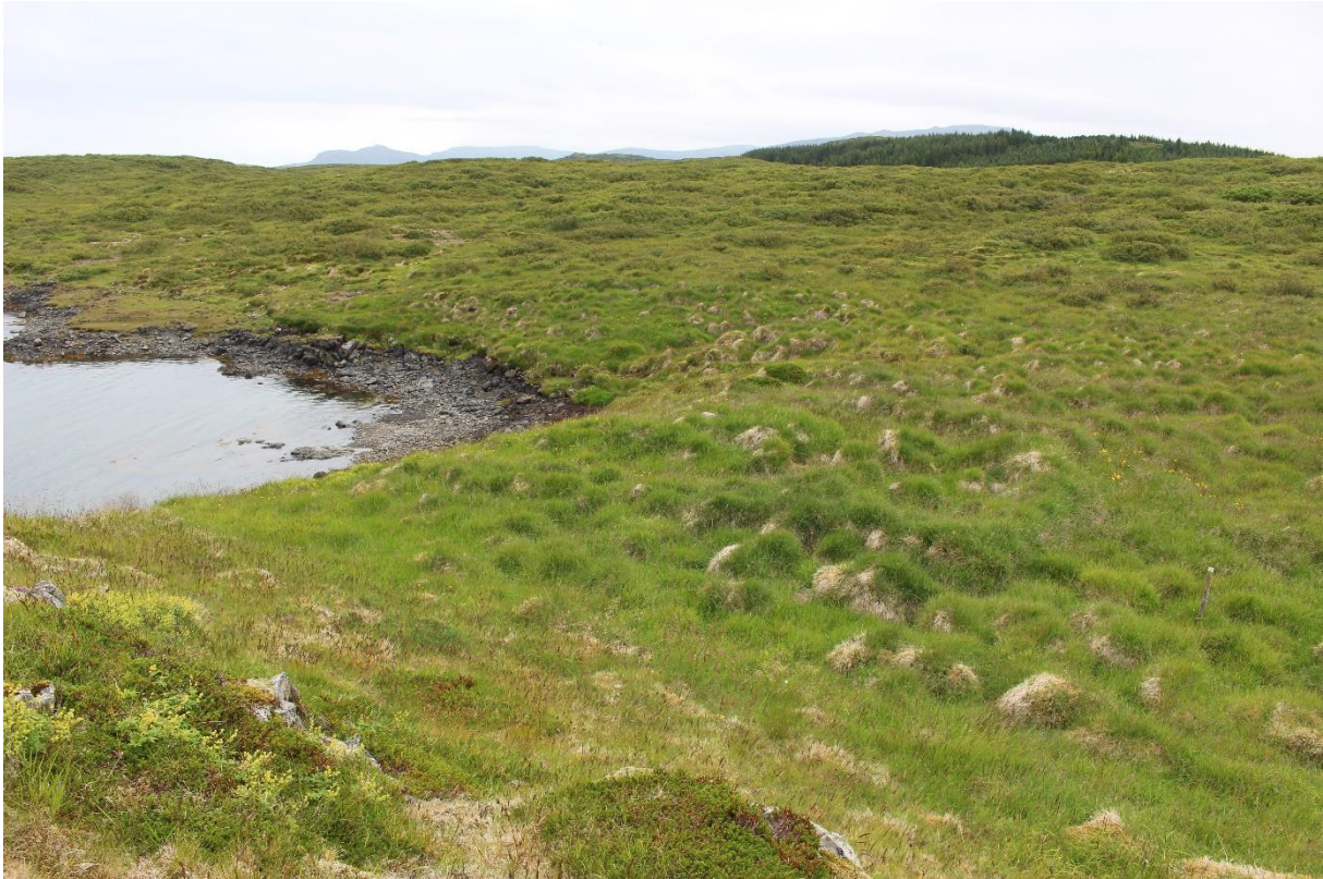
Mynd 5. Gruflunaust [3061-2], friðlýstar fornleifar við Grufluvík. Horft til suðausturs.