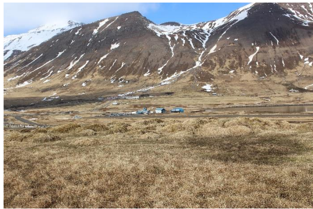
Mynd 4. Meint staðsetning kirkju [3001-3]. Horft til VSV.

Heimild um kirkju var skráð á þessum stað í gömlu skráningunni. Hóllinn er mjög þýfður en var nauðabittinn þegar skráningin fór fram. Ekki sást móta fyrir neinu mannvirki á hólnum og ekki voru vísbendingar um að kirkjuna mætti finna annars staðar á svæðinu.