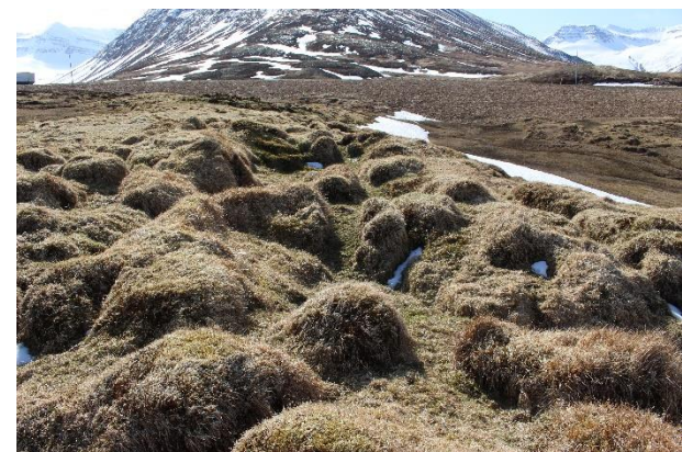
Mynd 7. Þúst [3001-6]. Horft til SSA.

eru op á rýmum óljós. Þústin er um 13,5x9 m að utanmáli. Veggjahæð er á bilinu 0,3-1,2 m og veggjabreidd mest um 2 m. Á stöku stað sést í grjót í veggjum.