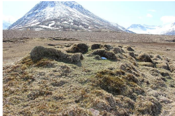
Mynd 13. Þúst [3001-12]. Horft til suðurs.

Þústin er um 6,5x3,7 m að utanmáli. Ógreinilegt innra rými er um 2,5x1,5 m að stærð. Grjót er sjáanlegt í veggjum, en ekkert op er greinanlegt á rýminu. Veggjahæð er á bilinu 20-80 cm. Veggjabreidd mest um 1 m, en syðst er ógreinilegur hluti þústarinnar sem er mun breiðari, um 2,5 m. Hugsanlega eru frekari mannvirkjaleifar sunnan við, en það þó óljóst. Þar er grjót sjáanlegt. Brattar brekkur eru beggja vegna að austan og vestan.