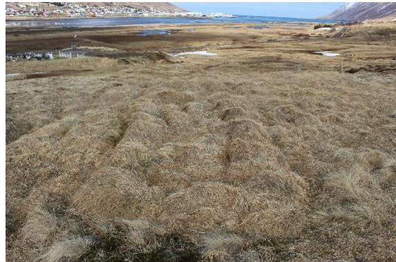
Mynd 15. Tóft [3001-14]. Horft til NNV.

Tóftin er sokkin en þó mjög greinileg að lögun. Hún er grasi gróin og hallar eilítið til norðurs, um 7x2,5 m að utanmáli. Tóftin snýr norðaustur-suðvestur en op er ekki greinanlegt á henni. Veggjahæð er á bilinu 20-40 cm og veggjabreidd mest um 1 m.