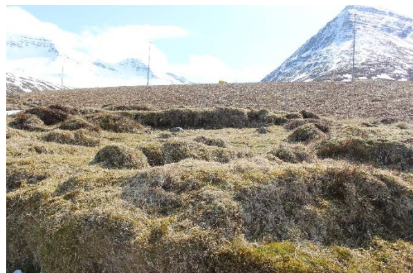
Mynd 11. Minjar [3001-10]. Horft til suðurs.

Grjót er greinanlegt hér og þar en þó ekki í austurbakkanum, þeim sem greinilegastur er. Veggjahæð er á bilinu 20-70 cm og veggjabreidd mest um 1 m.