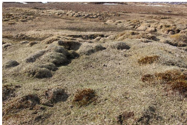
Mynd 5. Tóft [3001-4]. Horft til suðurs.

Tóftin er tveggja hólfa, snýr NNA-SSV og op eru á henni til beggja enda. Tóftin er um 11,5x7 m að utanmáli. Veggjahæð er á bilinu 20-60 cm og veggjabreidd mest um 1,3 m. Ofan/austan við tóftina er mýrardrag. Neðan/vestan við byrjar að halla niður brekku. Lækjardrag hlykkjast sunnan og vestan við og svo niður með bæjarhól.