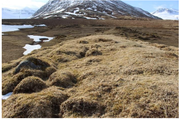
Mynd 3. Tóft [3001-2]. Horft til SA.

Tóftin snýr norðvestur-suðaustur og op virðist vera til norðvesturs. Markað gæti fyrir garða í miðju. Utanmál tóftarinnar er um 6x4,5 m. Brött brekka er austur af, niður að bæjarlæk. Veggjahæð er á bilinu 20-40 cm og veggjabreidd mest um 1,5 m.