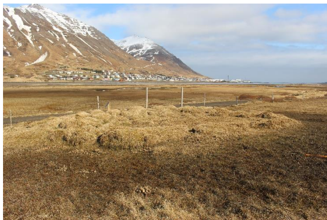
Mynd 2. Tóft [3001-1]. Horft til vesturs.

Utánmál tóftarinnar er um 10x9 m og innanmál greinanlegs rýmis er um 4x5,8 m. Veggir eru mjög þýfðir, signir og ógreinilegir, en nokkuð slétt er í miðju tóftarinnar. Veggjahæð er á bilinu 20-50 cm og breidd veggja mest um 3 m. Mýrardrag er í kring nema þar sem snýr að vegi.