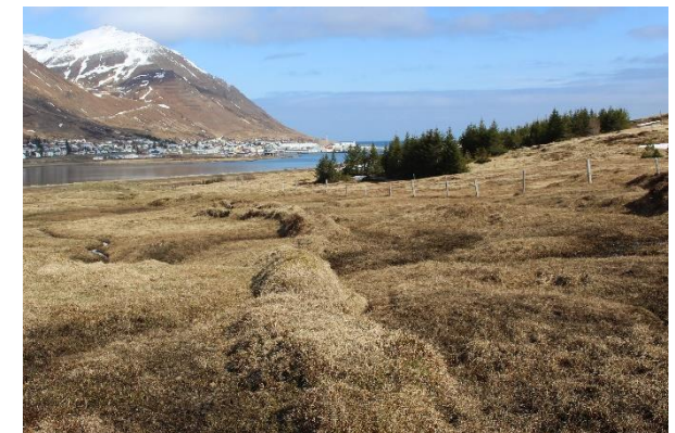
Mynd 8. Túngarður [3001-7]. Horft til norðurs.

Garðurinn er greinilegur á um 95 m kafla. Þar er hann vel gróinn og grjót vart sjáanlegt. Rof eru í garðinum hér og hvar vegna bleytu í túninu. Líklega er bleytan að miklu leyti ástæða þess að garðurinn er sokkinn og ekki greinilegur annars staðar. Veggjahæð er á bilinu 0,4-1,2 m og veggjabreidd best um 1,5 m.