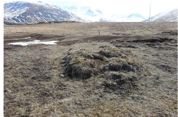
Mynd 14. Tóft [3001-13]. Horft til SV.

Tóftin er einföld og mjög sokkin, um 4,5x2 m að utanmáli. Op virðist vera á henni til norðurs. Norðausturhorn tóftarinnar er mjög greinilegt en tóftin er ógreinilegri til suðvesturs. Það finnst móta fyrir grjóti í veggjum þótt þeir séu