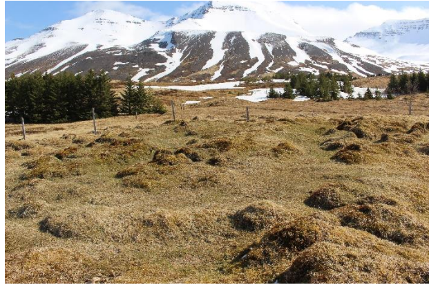
Mynd 6. Tóft [3001-5]. Horft til austurs.

kring er þýft en balinn sem tóftin stendur á er nokkuð sléttur. Lækur rennur fast sunnan við.