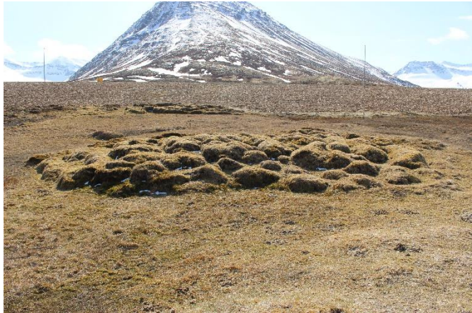
Mynd 12. Saurbæjarkot [3001-11]. Minjar [3001-10] sjást í baksýn. Horft til suðurs.

Ekki er hægt að greina rýmaskipan í hólnum, sem er mest um 20x16 m að utanmáli og stendur mest um 1 m upp úr flatanum. Hóllinn er vel gróinn og ekki sést í grjót. Hann gæti vel innihaldið mannvistarleifar og er líklegasta staðsetning Saurbæjarkots innan túnsins.