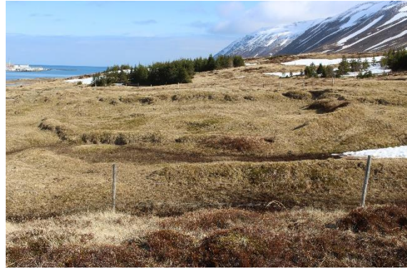
Mynd 9. Garðlag [3001-8]. Horft til norðurs.

Ekkert greinilegt op er á garðlaginu en þó eru rof á því á nokkrum stöðum og gæti eitt þeirra verið op. Utanmál svæðisins sem garðlagið afmarkar er um 22x12 m. Það sést í grjót hér og þar í garðlaginu en annars er það algróið. Veggjahæð er á bilinu 0,2-1 m og veggjabreidd mest um 1,2 m.