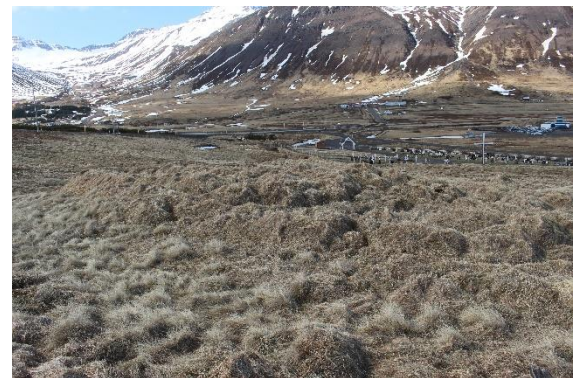
Mynd 16. Tóft [3001-15]. Horft til vesturs.

Svæðið sem talið var geta innihaldið mannvirki og mælt var upp er um 10x9,5 m að utanmáli. Veggjahæð er á bilinu 40-80 cm, þótt hóllinn sé á köflum nokkuð hærri en það, og veggjabreidd mest um 2 m. Með góðum vilja má greina þrjú rými og væri þá op á því syðsta til SV. Op eru ekki greinanleg á hinum rýmnum. Mögulega gæti verið um beitarhús með hlöðu að ræða, en mannvirkið er þó allt mjög illgreinanleg. Mögulegu rýmin eru syðst í þúfnakarganum en þýfið nær lengra norður, í átt að [3001-14].