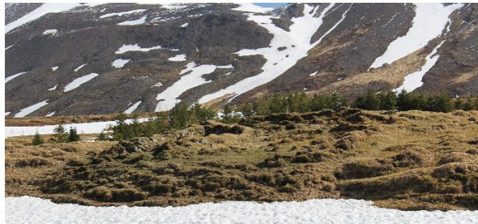
Mynd 10. Tóft [3001-9]. Horft til ANA.

Tóftin, sem líklega er fjárhús, er fjögurra hólfa og snúa þrjú þeirra austur-vestur. Fyrir aftan/austan þau er hólf sem snýr norður-suður, mögulega hlaða. Grjóthleðsla er mjög greinileg í norðurvegg, og víða annars staðar er grjót sjáanlegt í tóftinni. Tóftin er um 11x11 m að utanmáli og op eru á tveimur af A-V rýmum til vesturs. Veggjahæð er á bilinu 0,3-1,3 m og veggjabreidd mest um 1,5 m.