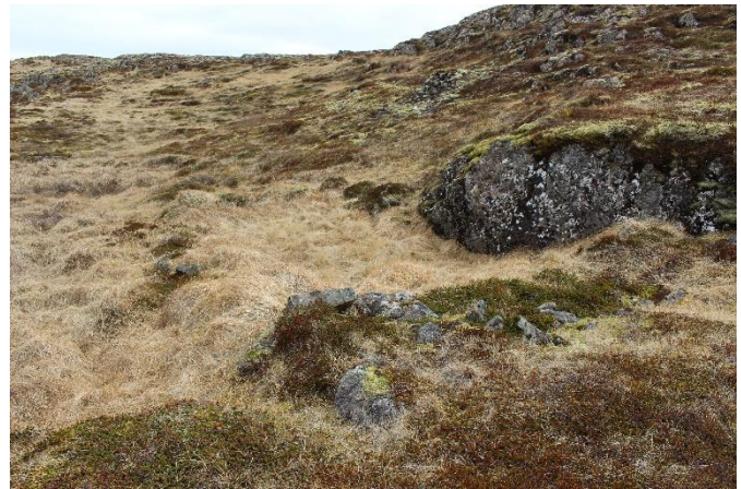
Mynd 7. Tóft [2999-6]. Horft til SA.

Tóftin er einföld og grjóthlaðin, hleðslan öll yfirgróin. Á suðurhlíð hefur stór klettur verið nýttur sem veggur. Innamál tóftarinnar er um 3x6 m og op er til NNA við NA horn. Breidd veggja er mest um 1,2 m og hæð veggja er um 20-60 cm. Líklega er um gerði eða stekk að ræða.