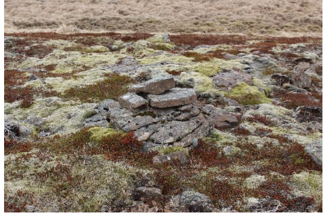
Mynd 15. Varða [2999-12]. Horft til norðurs.

Vörðubrot, um 60x60 cm að grunnfleti. Varðan er um 50 cm há með steininum sem hún stendur á. Tvö umför eru greinanleg í hleðslunni. Grjótið er fléttugróið.