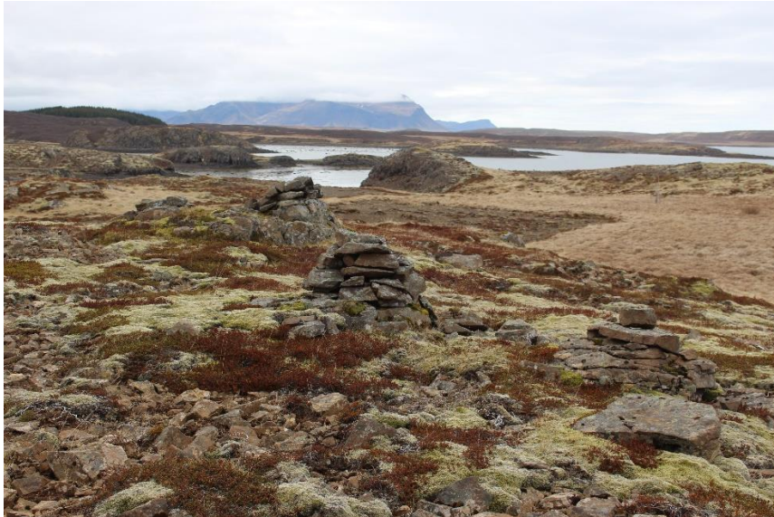
Mynd 16. Vörður [2999-12 til 14]. Horft til vesturs.