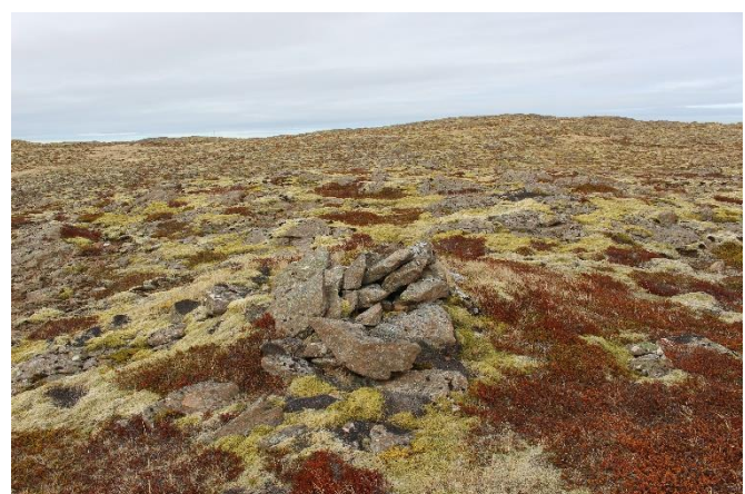
Mynd 11. Varða [2999-9]. Norft til norðurs.

Hrunin varða, hefur líklega verið sæmilega stór. Hrun er mest til vesturs. Grunnflötur vörðunnar er um 1x0,9 m og hún er um 60 cm há. Varðan er hlaðin úr flötum hellum að miklu leyti og þrjú umför sjást í hleðslunni að meðaltali.