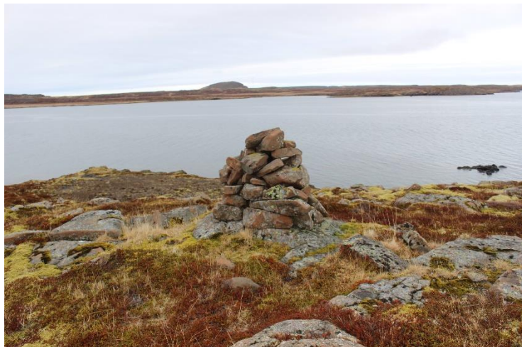
Mynd 2. Varða [2999-1]. Horft til norðurs.

Varðan er um 1,1 m á hæð og grunnflötur hennar er um 1x1,1 m. Sjö umför eru sjáanleg í hleðslunni, meðalstórt grjótið. Grjótið er gróið fléttum og varðan stendur vel.