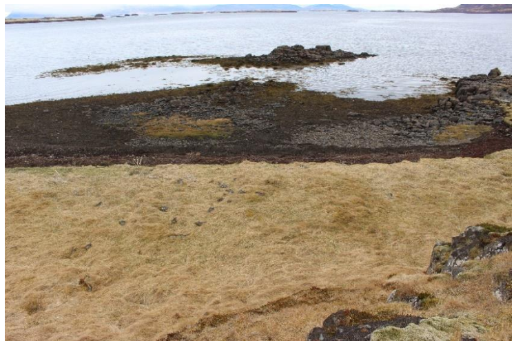
Mynd 13. Naust [2999-11] fyrir miðri mynd. Horft til austurs.