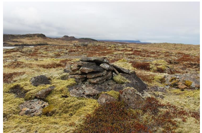
Mynd 10. Varða [2999-8]. Horft til vesturs.

Varðan er nokkuð hrunin en hefur líklega aldrei verið há. Hún er hlaðin úr flötum hellum sem er ólíkt vörðum [2999-1-5]. Grunnflötur vörðunnar er um 1x0,6 m og hún er um 40 cm á hæð. Fjögur-fimm umför eru sjáanleg í hleðslunni.