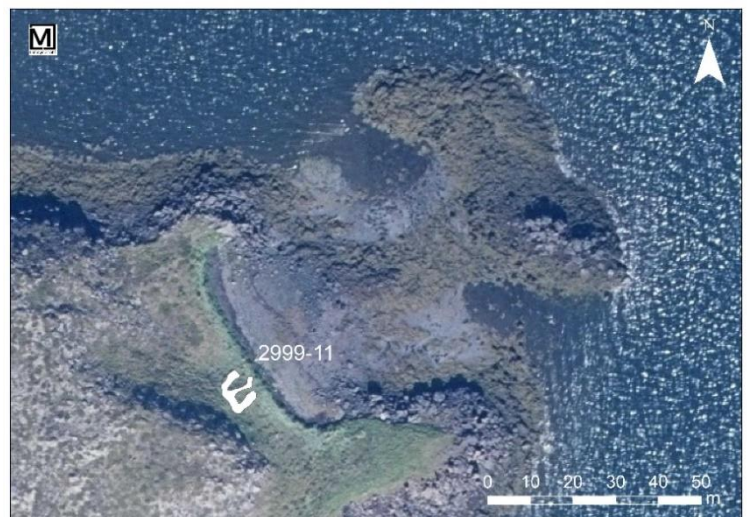
Mynd 14. Naust [2999-11], uppmæling.