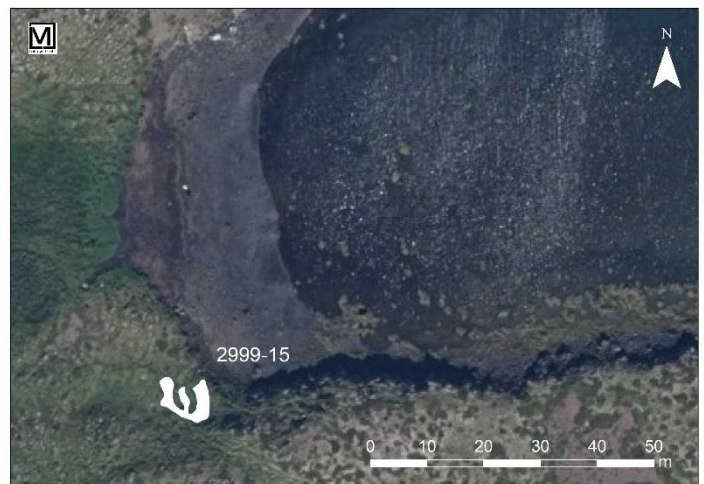
Mynd 20. Tóft [2999-15], uppmæling.