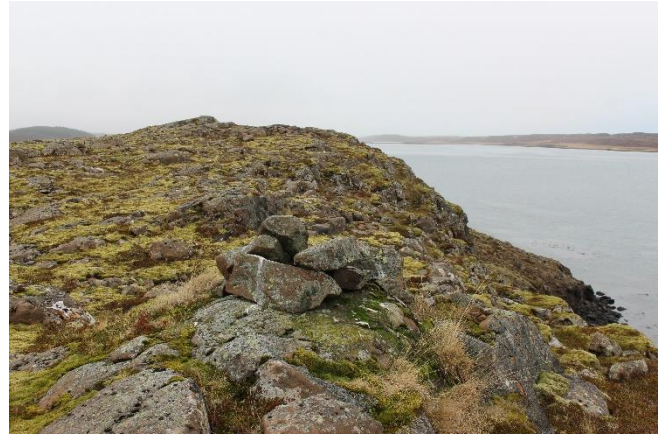
Mynd 6. Varða [2999-5]. Horft til vesturs.

Hrunin varða, mest hrunin til norðurs. Hæð vörðunnar er um 50 cm og grunnflötur hennar er um 1,1x0,7 m. Tvö umför eru sjáanleg í hleðslunni, meðalstórir til stórir steinar.