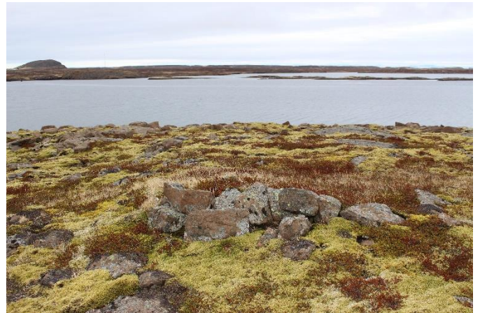
Mynd 4. Varða [2999-3]. Horft til norðurs.

Vörðubrot um 30 cm á hæð og 80 cm að grunnfleti. Hrun nær um 50 m út frá því sem virðist vera grunnur vörðunnar. Í vörðunni hefur verið meðalstórt grjót og er hún að hluta gróin yfir með lyngi og mosa.