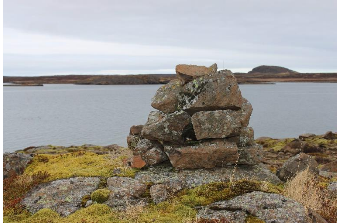
Mynd 3. Varða [2999-2]. Horft til norðurs.

Varðan stendur þokkalega en þó farið að hrynja aðeins, mest að NA verðu. Varðan er um 70 cm á hæð og grunnflötur hennar er um 70x70 cm. Fjögur umför eru sjáanleg í hleðslunni, lítið til meðalstórt grjót, fléttugróið.