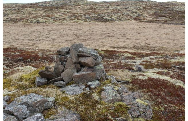
Mynd 18. Varða [2999-14]. Horft til norðurs.

Varðan er talsvert hrunin, mest til SV. Hleðslan er um 40 cm há en varðan er alls um 1 m há með steininum sem hún stendur á. Grunnflötur vörðunnar er um 80x70 cm og er hún hlaðin úr flötum hellum og hefðbundnu grjóti.