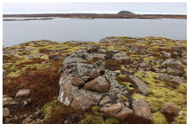
Mynd 5. Varða [2999-4]. Horft til norðurs.

Vörðubrot, gæti verið náttúrulegur frostprunginn steinn eða lítil, hrunin varða. Hæð 20 cm og grunnflötur um 70 cm.