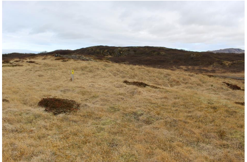
Mynd 21. Friðlýstar minjar [2999-16]. Horft til austurs.

Hóllinn er um 15x12 m að stærð. Rýmaskipting er vart greinanleg en með góðum vilja er hægt að greina 2-3 rými að norðan og austan. Veggjahæð er mest um 60 cm. Hóllinn er allur mjög gróinn og sokkinn.