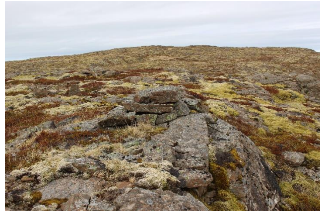
Mynd 12. Varða [2999-10]. Horft til norðurs.

Varðan er talsvert hrugin og hefur líklega verið nokkuð hærri. Hún er hlaðin úr flötum hellum sem og hefðbundnu grjóti. Grunnflötur vörðunnar er um 60x70 cm og hæð hennar um 30 cm. Varðan er hol að innan, sést það á norðurhlið.