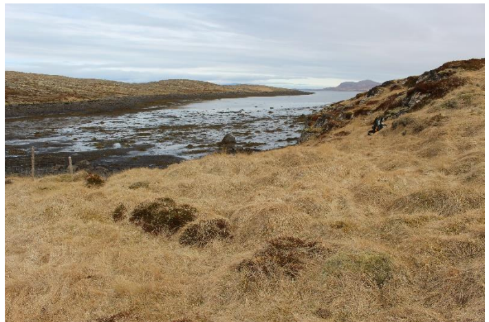
Mynd 19. Tóft [2999-15]. Horft til austurs.

Tóftin er tvöföld, mjög gróin og nokkuð sokkin. Tóftin snýr baki í brekkuna og opnast til norðurs. Innanmál rýmanna, hvors um sig, eru um 1x2 m. Veggjahæð er um 0,2-1 m og veggjabreidd er mest um 1,5 m. Grjót sést ekki í veggjum en það finnst móta fyrir því undir gróðrinum. Hugsanlega getur verið um lítið naust að ræða.