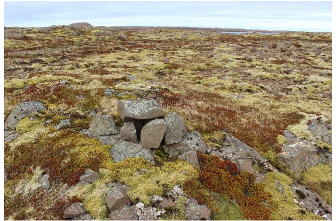
Mynd 9. Varða [2999-7]. Horft til norðurs.

Vörðubrot, hrun sést í kring. Grunnflötur er um 70x40 cm og varðan er um 40 cm á hæð. Tvö umför eru sjáanleg í hleðslunni og ljóst að varðan hefur aldrei verið stór.