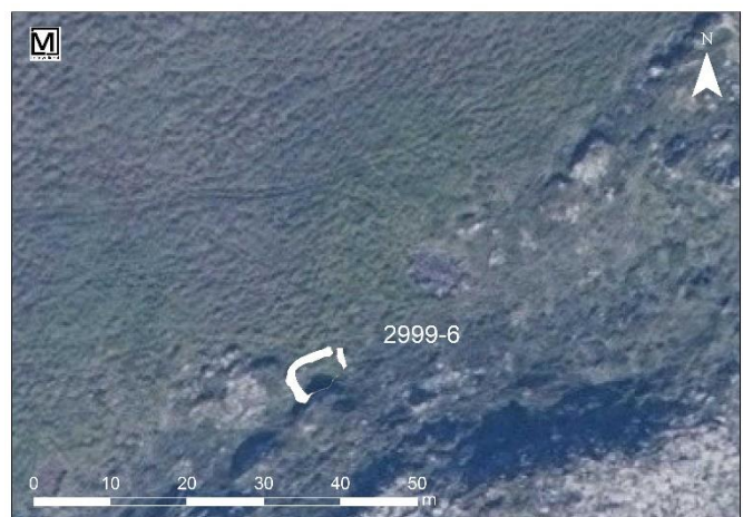
Mynd 8. Tóft [2999-6], uppmæling.