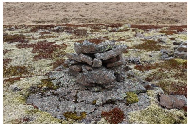
Mynd 17. Varða [2999-13]. Horft til norðurs.

Varðan er um 50 cm há, um 80 cm með steininum sem hún stendur á. Grunnflötur vörðunnar er um