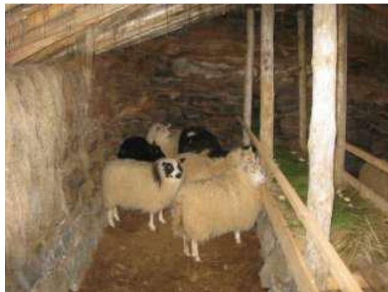
Mynd 1. Á leið inni Hólhúsin þar sem ilmandi hey er á garða. Mynd 2. Gimbrar í nyrðri krónni.