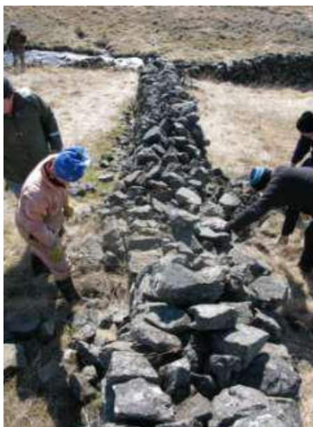
Myndirnar sýna nýjan einhlaðinn vegg á hlaðinu í Flatatungu og viðgerð á tvíhlöðnum vegg í gamalli skilarétt í Silfra-staðaffalli á grjóthleðslunámskeiði 2009.