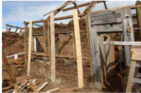
Mynd 1. Framhúsið áður en þakið var tekið niður á fyrri timburviðgerðanámskeiðinu 2009. Mynd 2 er tekin þegar búið var að taka þilið af framhúsinu.