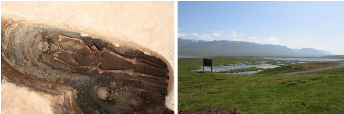
Myndir frá Hegranesþingstað. Mynd 1 sýnir beinagrind tveggja 11. aldar kvenna. Mynd 2 sýnir hvar kirkjugarðurinn er syðst á meintum þingstaðnum.

Á Mið-Grund, sem ekki er nefnd í ritheimildum sem kirkjustaður fyrr en á 18. öld var staðfestur 11. aldar grafreitir.