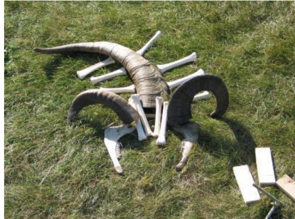
Gömlu leikföngin eru sívinsæl enda hægt að búa stórt og smátt eftir vild, og búa til hvaða fyrirbæri sem er úr hornum og beinum.