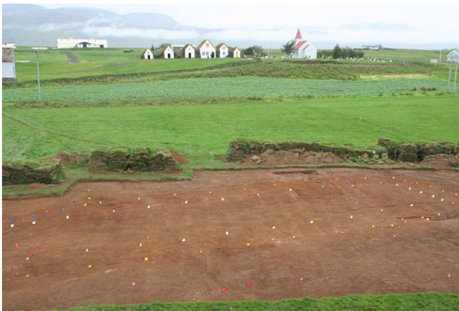
Yfirlitsmynd yfir skálatóftina í túninu neðan Glaumbæjar. Skálinn er um 33 m langur og 8 m breiddur. Veggir skálans eru afmarkaðir með hvítum og rauðum veifum á myndinni.