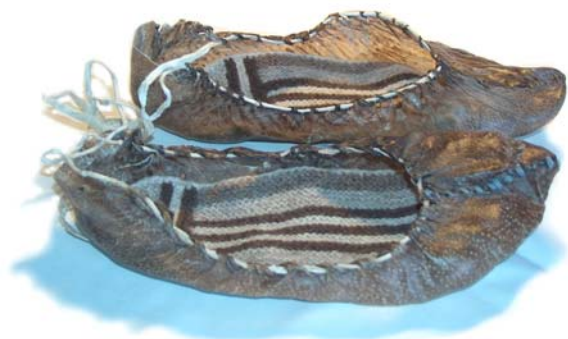
Roðskór með illeppum