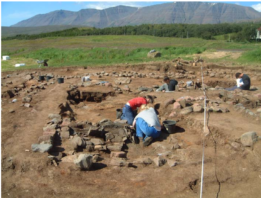
Nemendur sem taka þátt í vettvansnámskeiðunum fá tækifæri til að spreyta sig við hin ýmsu verkefni fornleifafraeðinnar, ss. fornleifaskráningu og -uppgröft.