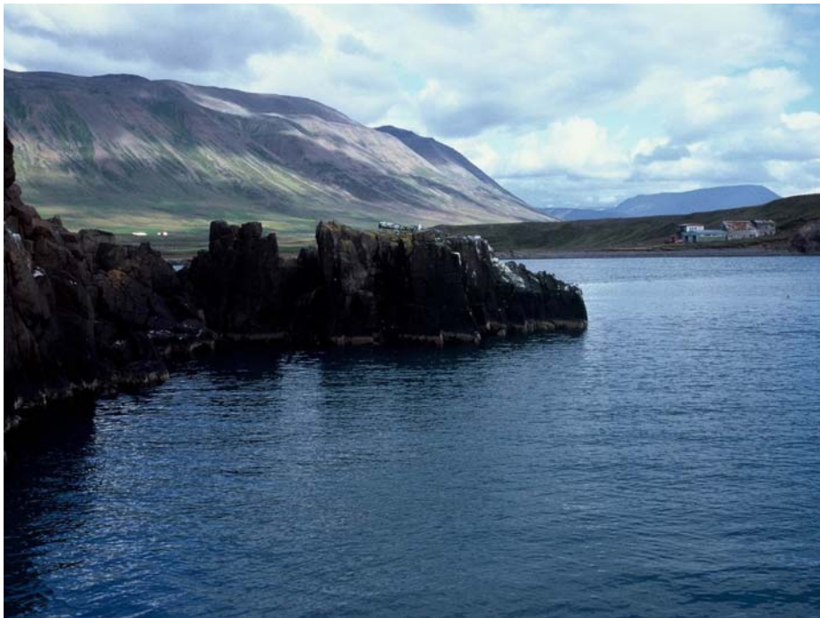
Skipalægi sunnan Elínarhólma við Kolkuós. Þarna er aðdjúpt og hefur verið nokkuð góð náttúruleg höfn fyrr á öldum.

Komið hefur í ljós að fyrr á öldum voru aðstæður með þeim hætti við Kolkuós að skip gátu siglt mjög nálægt landi og lagst í var við Elínarhólma, sem til forna var landfastur á eiði sem nú er í um tveggja feta dýpi. Þetta var meginhöfn Skag-firðinga á Landnámsöld og fram á snemmmiðaldir og hefur örugglega ráðið úrslitum um það að Hólar í Hjaltadal urðu þéttbýl valdamiðstöð, biskupsstóll og fræðasetur. Við ósinn hafa fundist nokkrar kynslóðir verslunarbúða og vitnisburður um innflutning svo sem ávexti og korn. Smæstu agnir eru jafnmikilvægar og stærri leifar eins og gjall og eldstæði sem vitna um járnvinnslu á staðnum. Við ósinn hefur einnig fundist víkingaaldarminjar svo sem gröf heiðins manns og fórnardýrs, silfurpeningur, dýrabein, svo sem hundabein margra hundategunda og margt fleira. Í stuttu máli má segja að umsvif og verslun í Kolkuósi (Kolbeinsárósshöfn) voru mikil í um 500 ár.