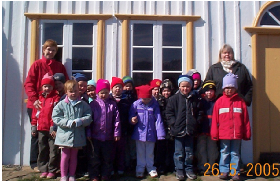
Útskriftar börn frá Leikskólanum í Birkilundi í Varmahlíð í heimsókn í Glaumbæ, sem hefur verið árviss atburður frá stofnun leikskólans. Grunn- og framhaldsskólanemendur heimsækja okkur í Glaumbæ allt árið um kring.

Nemendur leiðsögumannaskólans komu við í 10. sinn í hringferð sinni um landið og fengu fyrirlestur um sögu og stöðu safnsins, tilgang þess og birtingarform.