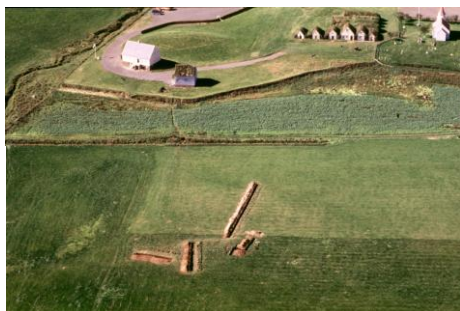
Á loftmyndinni sést hvar rannsóknarsvæðið var í Glaumbæ sumarið 2002. Neðst á mynd.

Fornleifarannsókn SASS (The Skagafjörður Archaeological Settlement Survey). Safnið er aðili að rannsókn fornleifa- og jarðfræðinga frá UCLA, Northwestern University, Smithsonian og fleiri stofnunum, í Glaumbæ og á horfnum jarðlægum húsum á Hólum í Hjaltadal, Viðimýri, nokkrum