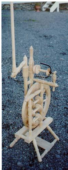
Þessi rokkur er afsprengi 19. aldar rokks af Reykjaströndinni. Á honum er hægt að geyma 3 snældur og upp af honum gengur tangi þar sem hægt er að festa á lampa.

Hinn árlegi safnadagur var aðra helgina í júlí. Unnið var við tóskap: tekið ofan af, ullin kembd, spunnið á snældu, þrjónað og heklað, sokkar þæfðir og kveðnar stemmur. Unnið var við heyskap: slegið með vél og orfi, rakað og snúið. Sýndar voru aðferðir við fornleifauppgröft úti í öskuhaug, smjör var strokkað í Litlabúri og tunnur girtar í Langabúri. 2