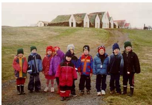
Leikskólanemendur frá Varmahlíð safnheimsókn vorið 2002.

Eins og undanfarin ár var tekið á móti mörgum skólahópum í Glaumbæ og Minjahúsinu á Sauðárkróki. Einnig var veitt ráðgjöf við ritgerðavinnu og önnur verkefni. Einn grunnskólanemi kom í starfsfræðslu í safnið, eins og verið hefur nokkur undanfarin ár.