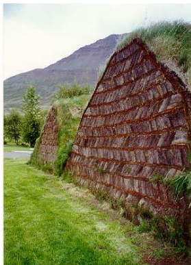
Torfhleðsla er merkilegt handverk, sem því miður er á hverfanda hveli.